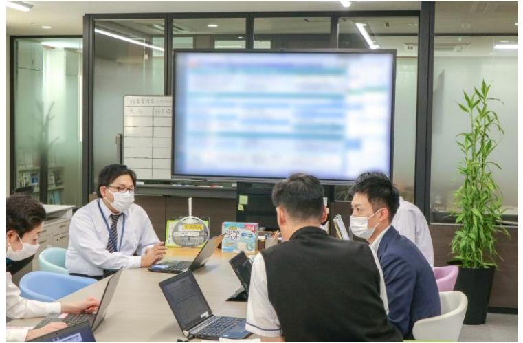
MAXHUBに会計ソフトを投影することで 数字も見やすい

また、MAXHUB自体がOSを搭載していてPCの様な製品であるため、手元のPCから資料を投影するだけでなく、MAXHUBから社内のサーバーにアクセスし、直接資料を表示することも打ち合わせの際には便利です。従来のプロジェクターやディスプレイではできない使い方ではないでしょうか。