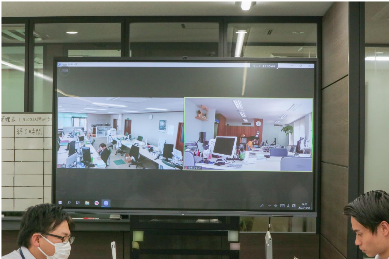
各事務所同士を常時WEB会議システムで繋いでいる

最近では、事務所が増えたので、 各事務所同士を常時WEB会議システムで繋ぎ、朝礼を行う他、社内放送の代わりとしても活用 しています。事務所間に距離があっても、お互いの状況が把握できるので良いですね。本社以外の事務所では現状、MAXHUBを導入していないので、接続していると他の製品とMAXHUBとで音質の差を感じます。